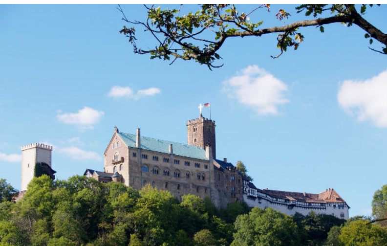
Die Wartburg bei Eisenach.

Schon seit über 100 Jahren zieht der Rennsteig Jahr für Jahr unzählige Menschen in seinen Bann. Stellt der Höhenwanderweg doch auf einmalige Weise eine Verbindung zwischen Natur, Geschichte und Tradition sowie der Werra mit der Saale her. In der Sage zum Rennsteig heißt es: Der wahre Wanderfreund nimmt sich vom Ursprung einen Stein aus der Werra, trägt ihn bis zum Ende an der Saale in seiner Tasche und wirft ihn dort wieder ins Wasser.