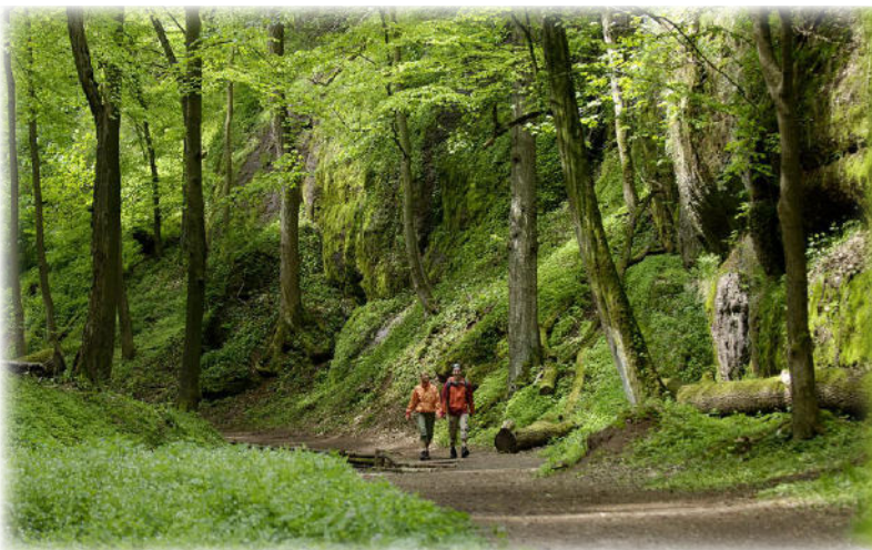
Gemütliche Rast auf einer Waldlichtung.

Sie möchten sich etwas mehr Zeit für Ihre Rennsteigtour lassen? Dann ist diese Wanderreise die richtige für Sie. Im Vergleich zur KLASSIK-Tour haben Sie weitere Übernachtungen in Ruhla, Spechtsbrunn und Grumbach.