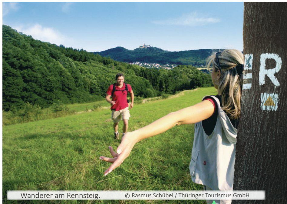
Wanderer am Rennsteig.