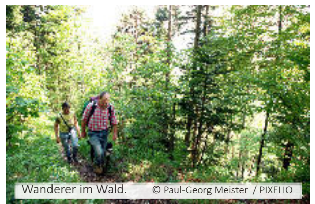
Wanderer im Wald.