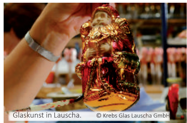
Glaskunst in Lauscha.