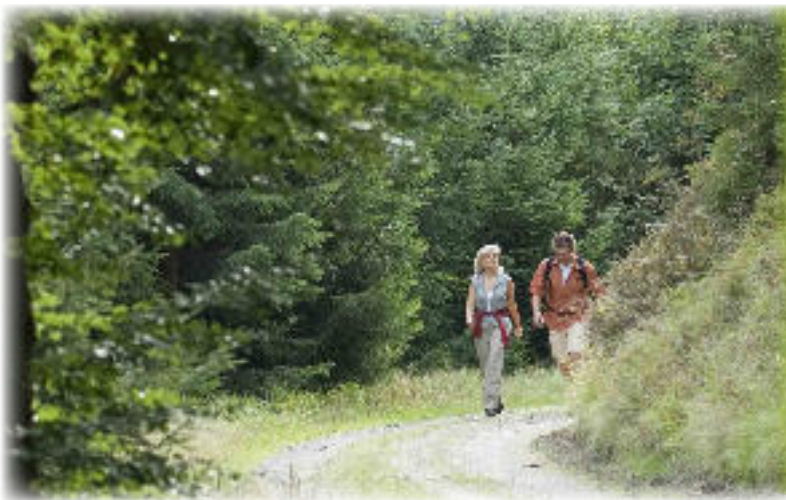
Wanderer am 6-Kuppensteig.

Namensgeber für den Qualitätsweg sind die sechs Berge, im Sprachgebrauch der Einheimischen auch „Kuppen“ genannt, die der Wanderer im Verlauf des Weges erklimmt. Alle sechs sind über 800 Meter hoch. Der Rundwanderweg verläuft ausschließlich auf historischen Wanderwegen, wobei der Rennsteig der wohl bekannteste sein dürfte.