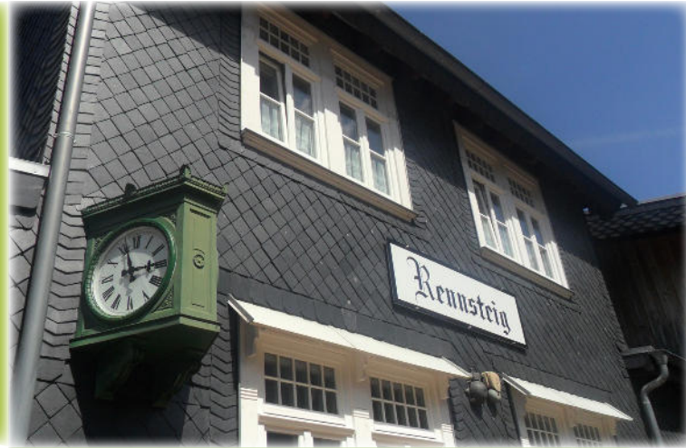
Am Rennsteigbahnhof bei Ilmenau.

Mit uns erwandern Sie den Rennsteig MITTENDRIN!