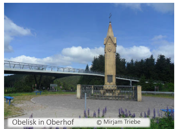
Obelisk in Oberhof © Mirjam Triebe