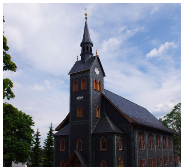
Holzkirche in Neuhaus.