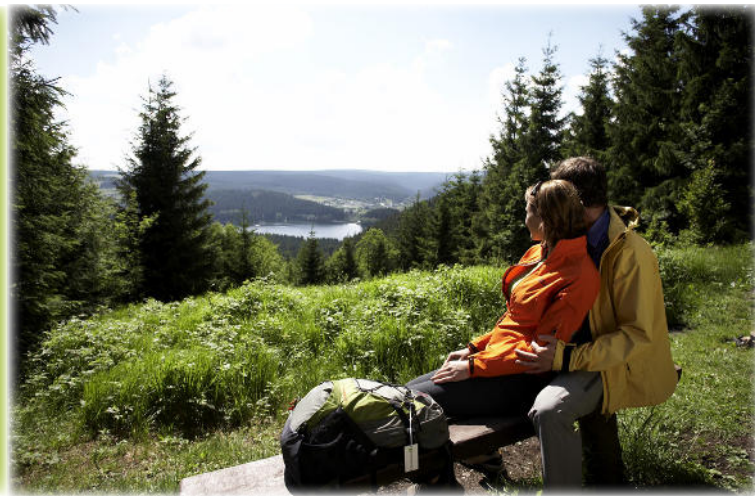
Ruhe und Erholung finden Sie am Rennsteig.

Wandern Sie mit uns GENIEßERisch entlang des Rennsteigs!