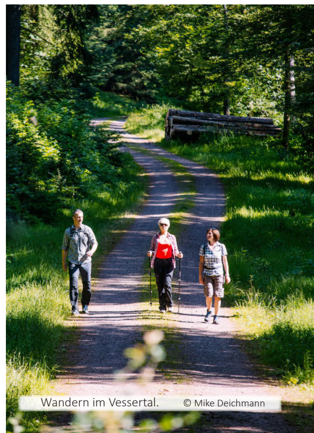
Wandern im Vessertal.